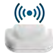
"Smartbox" (se vende por separado)

Instala nuestra Smartbox (69€) y descárgate nuestra app gratuita para controlar tus emisores IRIS en tiempo real y desde cualquier lugar del mundo .